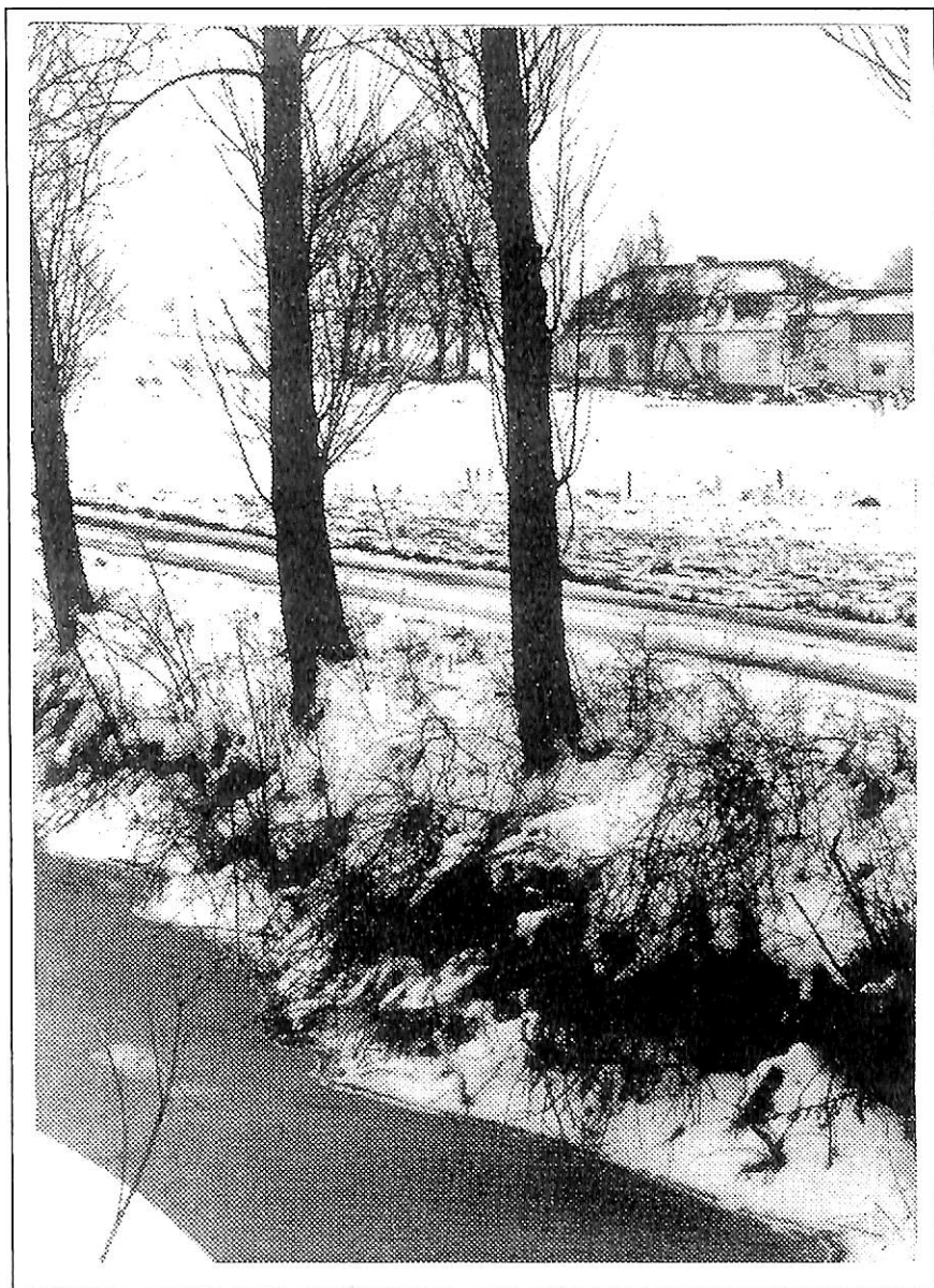
Bief et moulin de Bienne-lez-Happart