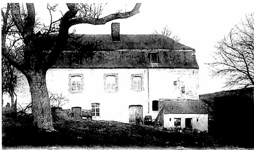
Bienne-lez-Happart. — Le moulin datant de 1414.